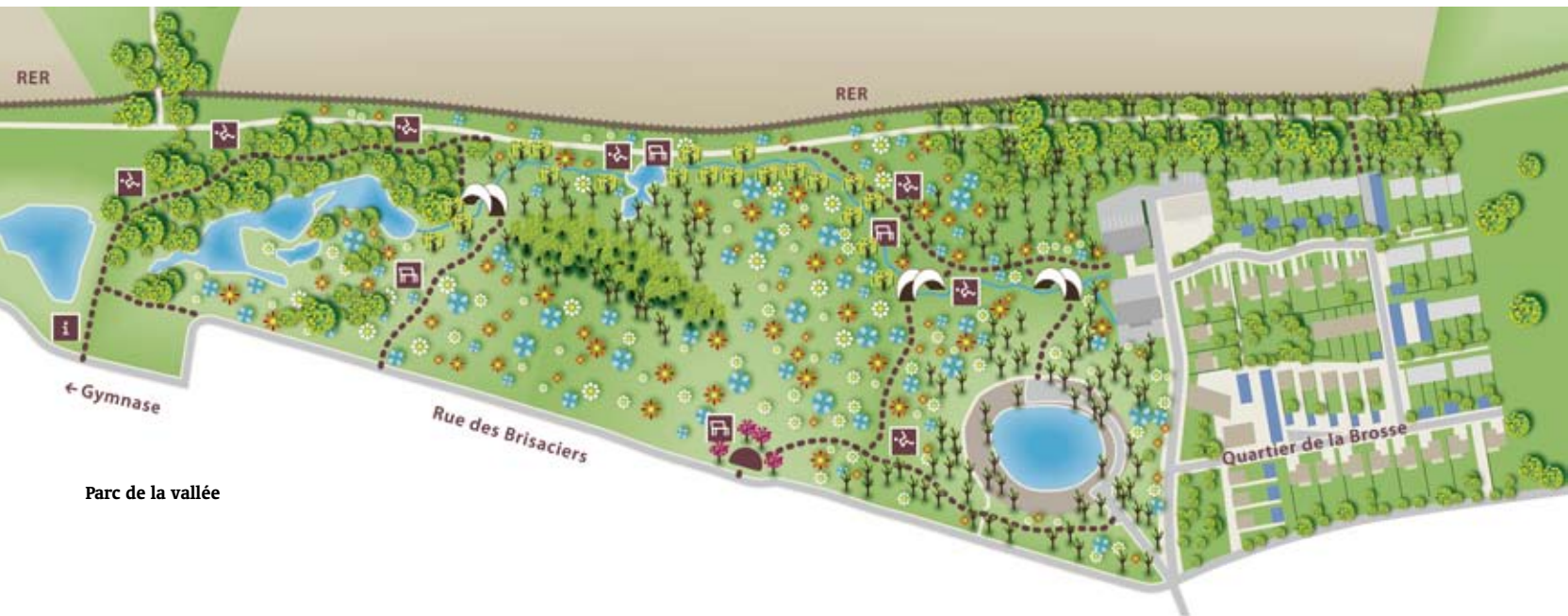
Parc de la vallée

Si chaque nouvelle année apporte son lot de bonnes résolutions, le sport et le mieux-être physique figurent toujours en haut de liste. Bientôt, on pourra certifier que plus personne n'aura d'excuse pour se défilier puisque du Nord au Sud de la commune, la forme sera à l'honneur.