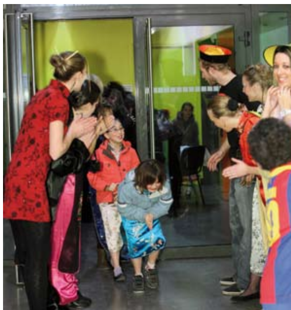
Entrée des enfants dans leur fête

Au fait, vous aviez une meilleure idée pour entrer en 2011 ? ■