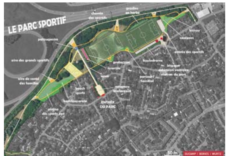
Parc sportif, du côté du stade Jacky Rivière

ci-dessous). Dès février, une première phase de concertation réunira services municipaux, associations et partenaires jusqu'au printemps. Une fois le projet défini, une phase de consultation des entreprises durera jusqu'à juillet, pour un démarrage des travaux fin 2011. Finalisation du projet pour 2013.