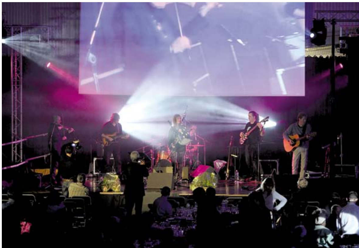
Concert du groupe Celt'hic

a énuméré les projets à venir : la mise en réseau des catalogues de bibliothèque du territoire, et à partir de septembre prochain, la création du conservatoire de musique de Marne-et-Gondoire (cf. p11). Autre projet qui devrait être finalisé d'ici la fin de cette année, le Schéma directeur d'aménagement du Territoire, qui va permettre de définir et d'arrêter une vision à 15/20 ans de Marne-et-Gondoire avec des enjeux très importants comme la préservation et la pérennisation des espaces naturels et agricoles.