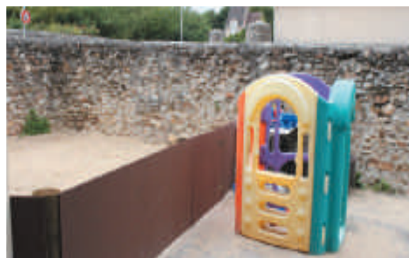
Le bac à sable de la cour du centre de loisirs