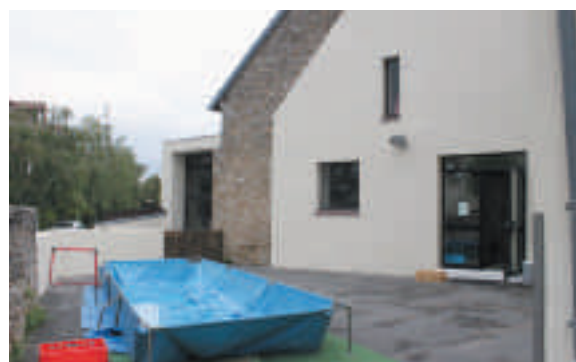
La façade extérieure de la cour du centre de loisirs