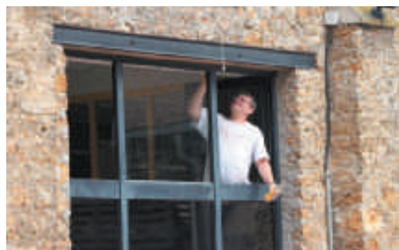
La salle des ateliers du centre de loisirs