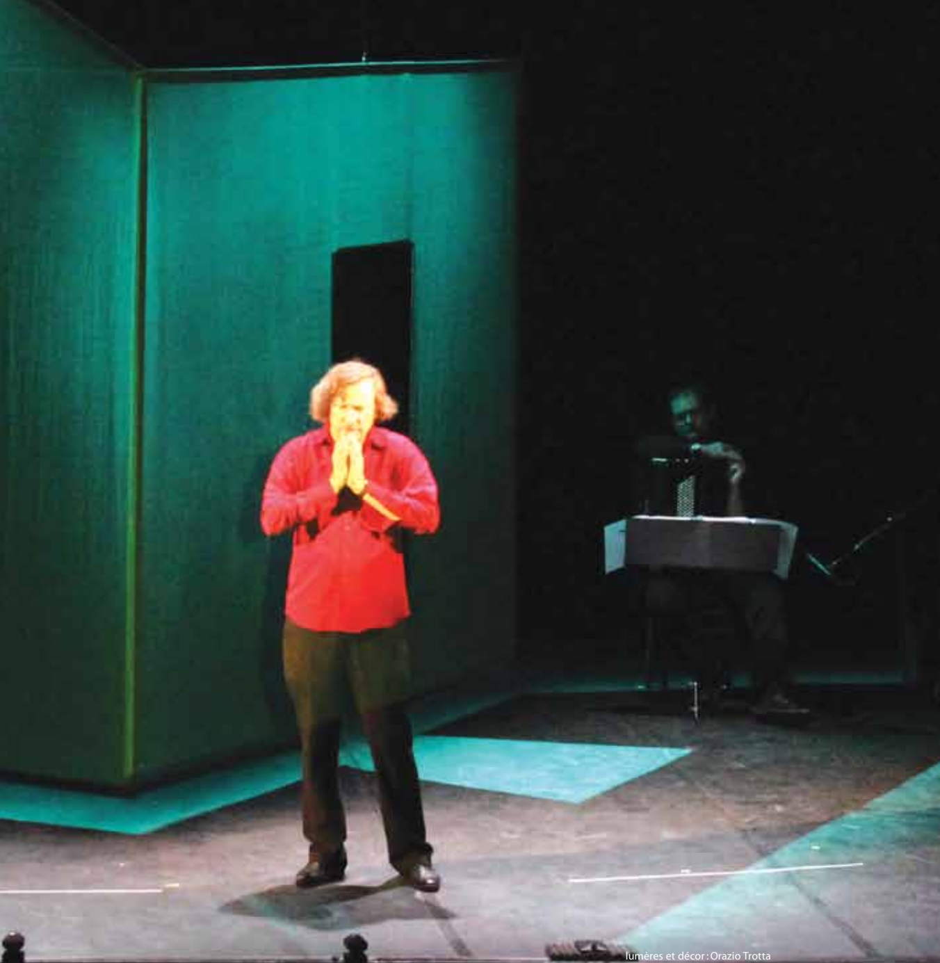
lumères et décor : Orazio Trotta la compagnie est conventionnée DRAC Ile-de-France et subventionnée par le Conseil général de Seine- et-Marne